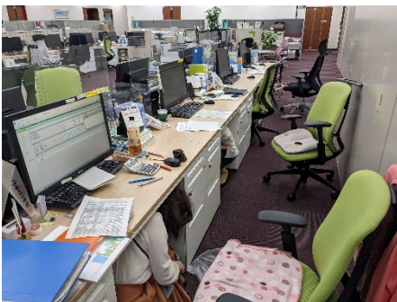
（一斉に机の下に入る社員）