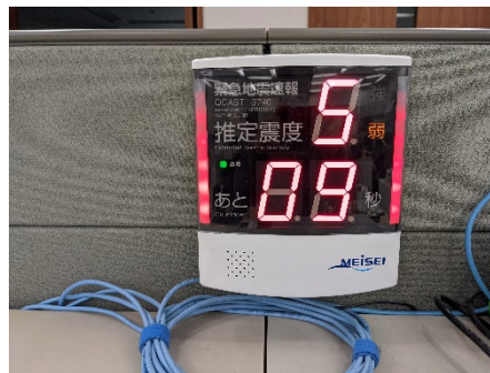
（地震の揺れまであと9秒）