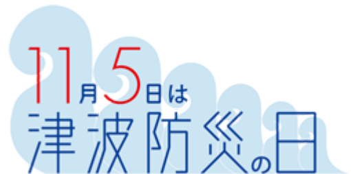
「津波防災の日」正式ロゴマーク

当社では本社内に気象庁提供の緊急地震速報を受信する端末を設置しており、来訪者、役職員の身の安全の確保に役立てています。