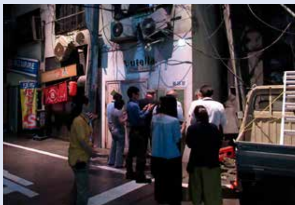
<「そなエリア東京防災体験学習施設」での外部演習>

演習を実施することにより、各自のBCMや防災への意識を高め、更なる震災対策態勢の実効性の向上を図っています。