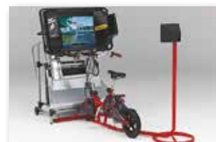
<自転車シミュレータ>