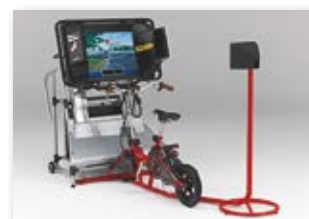
<自転車シミュレータ>